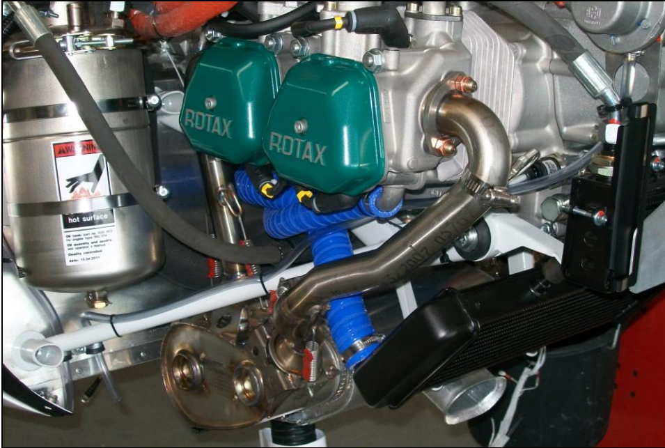
Fig. 4 - Routing der Drainageschlauches