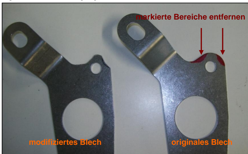
Fig. 2 - Modifikation des Befestigungsbleches