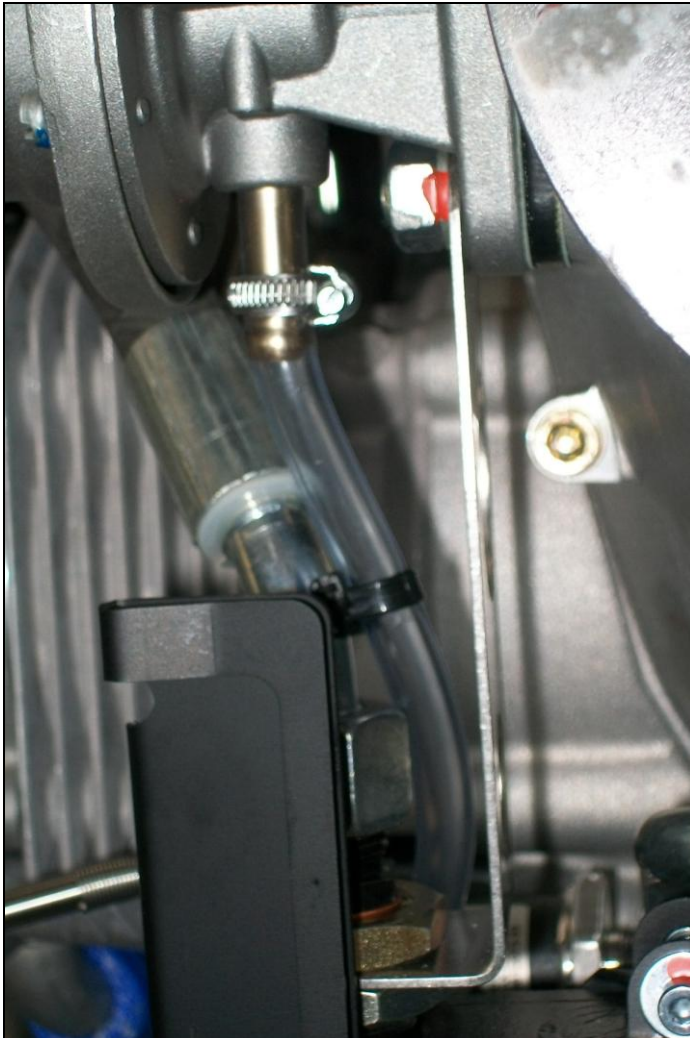
Fig. 3 - Befestigung des Drainageschlauches an der Treibstoffpumpe