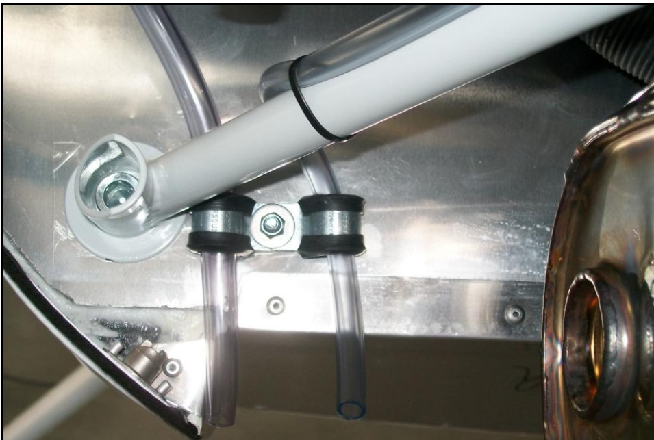
Fig. 5 - Befestigung des Drainageschlauches an der Firewall mit Hilfe der Schelle