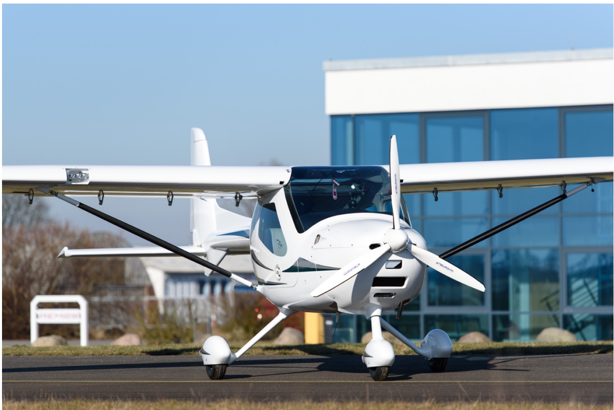
Auch die ultraleichte REMOS GXNXT kommt im April zur AERO nach Friedrichshafen.